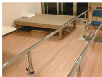
リハビリスペース